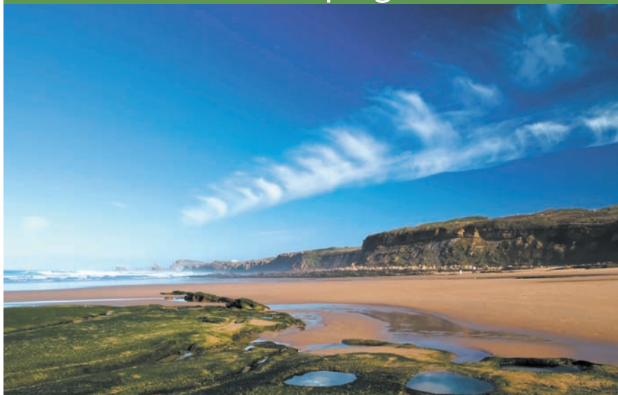
Côte cantabrique