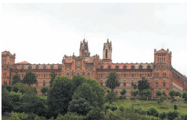
Université pontificale de Comillas

Pour des raisons techniques, certaines journées d'excursions pourront être inversées.