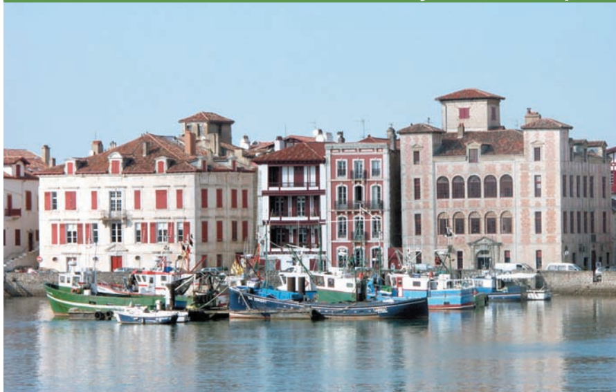
Maison de l'Infante à Saint-Jean-de-Luz