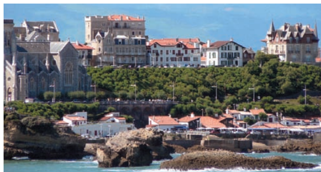
Biarritz et La Rhune

Dans notre programme en juillet est incluse une soirée spéciale aux Internationaux de Cesta Punta au Jaï Alaï (date précise communiquée ultérieurement). 2 h de spectacle dans une ambiance chaleureuse : une soirée culturelle ponctuée par des danses et des chants basques, mais aussi sportive avec la discipline la plus spectaculaire de la pelote. Pour animer la partie, les spectateurs seront invités à un concours de pronostics sur les équipes gagnantes et un tirage au sort aura lieu en fin de partie pour désigner 3 gagnants.